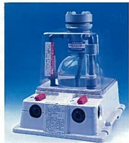
ペースフィーダー