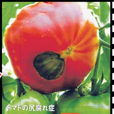
トマトの尻腐れ症