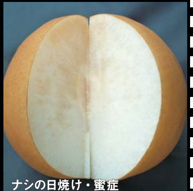
ナシの日焼け・蜜症