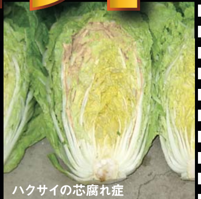
ハクサイの芯腐れ症