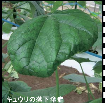
キュウリの落下傘症