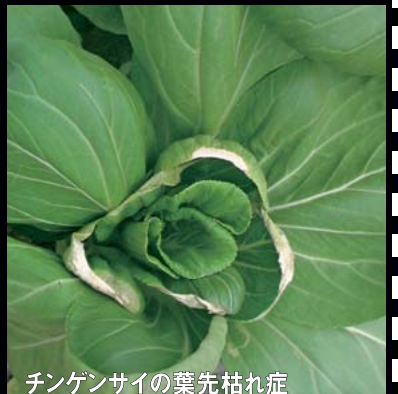
チンゲンサイの葉先枯れ症