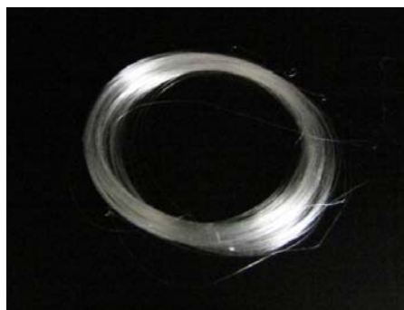
コラーゲンファイバー