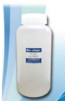
ブルーコラーゲンF-15A