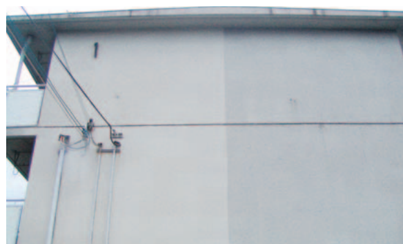
光触媒による壁面の防汚例 (左側が光触媒施工面)

光があたることで有害物質を分解したり、抗菌性を発現する光触媒材料を開発しています。空気清浄機や外壁材など、身の回りの製品にも利用されつつあります。